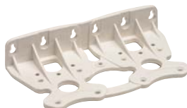
supporto murale -DU0-