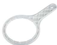
chiave per Depural® TOP