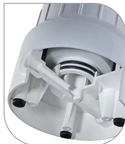
BX cartucce ad innesto rapido con doppio o-ring 45 mm per una perfetta tenuta.