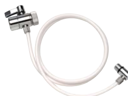
tubo con DVB valvola diverter e raccordo in ottone da 1/4"