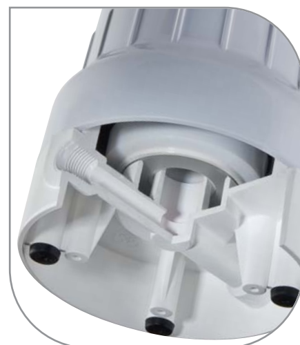
SX cartucce con tenuta a schiacciamento.